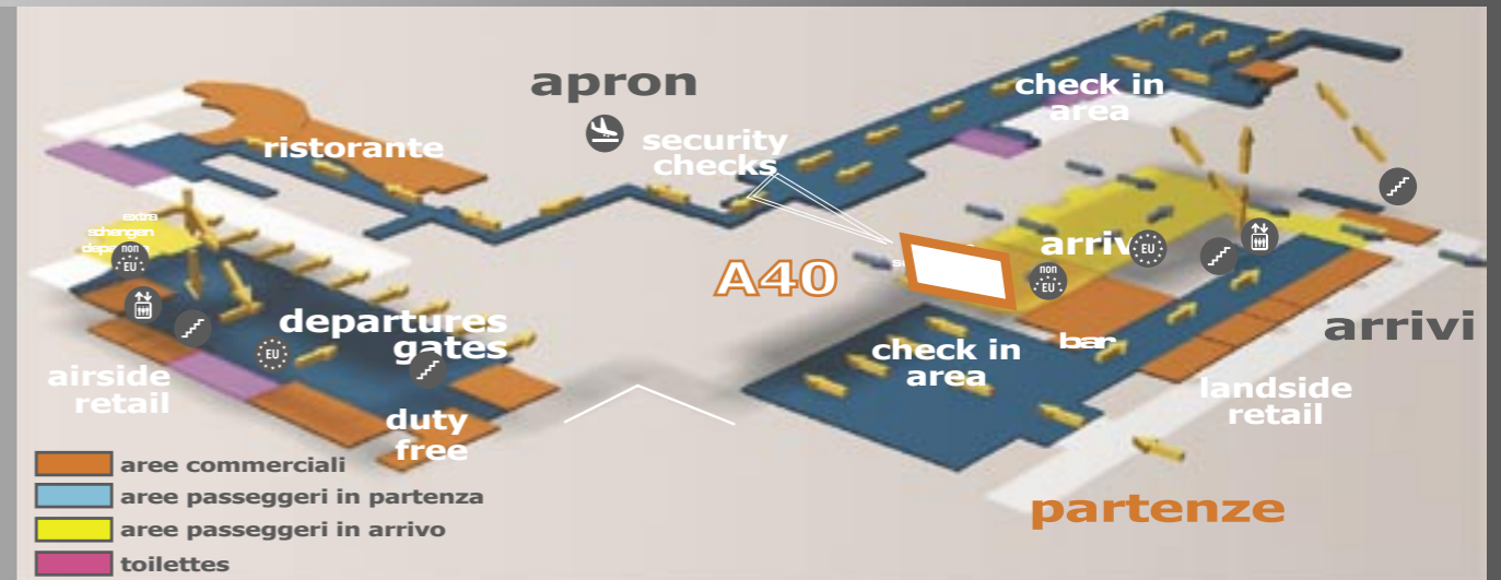
schema dei flussi arrivi/partenze

Alta visibilità dall'area riconsegna bagagli