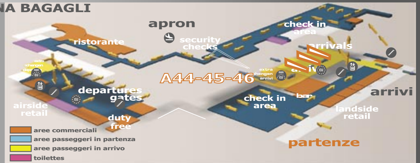
schema dei flussi arrivi/partenze

visibilità passeggeri arrivi ALTA flussi obbligati SI retroilluminazione SI