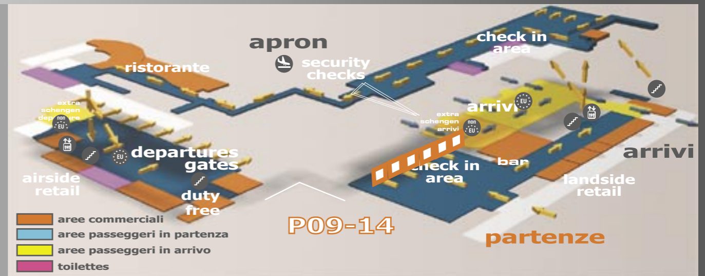
schema dei flussi arrivi/partenze

visibilità passeggeri partenza SI visibilità meeters and greeters SI flussi obbligati SI retroilluminazione SI